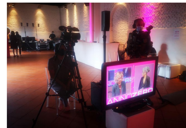
◆ Main Studio Forum Sistema Salute, UoI Firenze