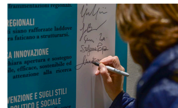
♦ Il Manifesto del Cracking Cancer